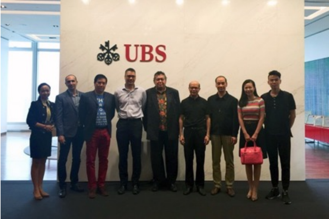
그리고이 그룹의 리더 인 인물 : 악명 높은 로우씨 (오른쪽)