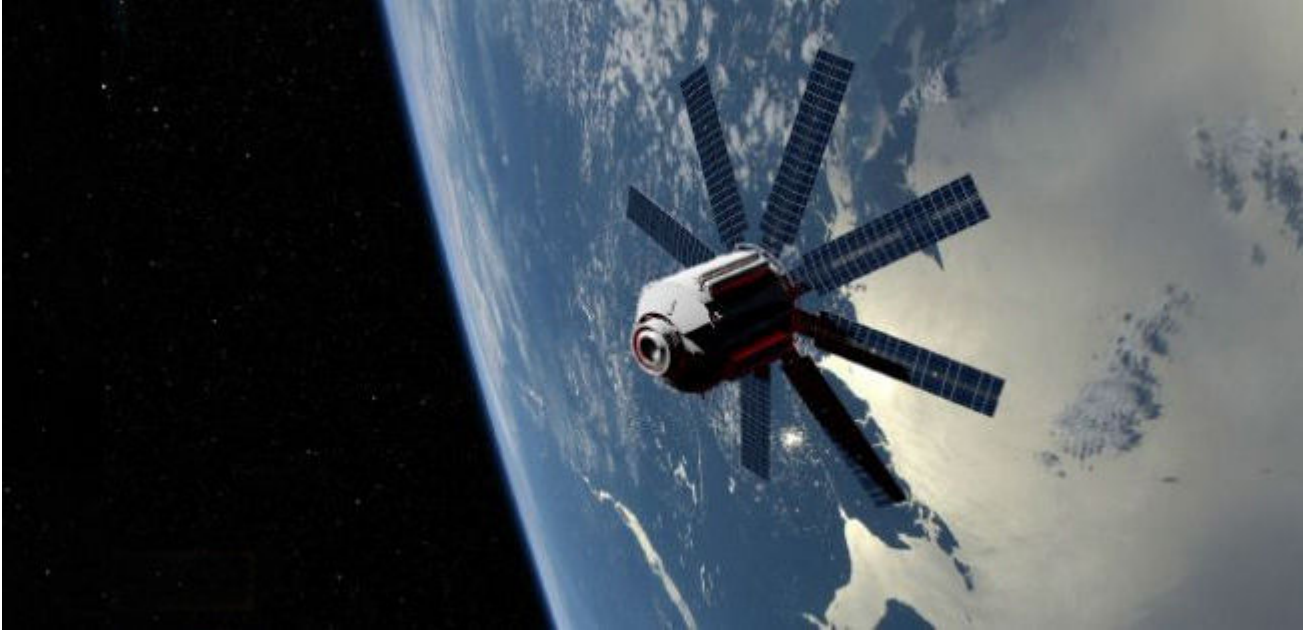
Imagen de ejemplo – no podemos te mostramos lo que realmente parece!

En consecuencia, podemos monitorear por nosotros mismos, ver quien se atreve a intentar entrar en los bunkers o almacenes. Identificarán cualquier y todos los intentos, y los detalles relevantes enviaron a varias unidades operativas clandestinas para la aprehensión. Esto no es sobre el oeste tanto como es el este, oriente, aunque el oeste está siendo observado así. Por esta razón, con este satélite de vanguardia en su lugar, no es necesario para Neil volar a Asia / Indonesia cuando se hizo consciente de cada movimiento poco riesgoso nadie intenta hacer.