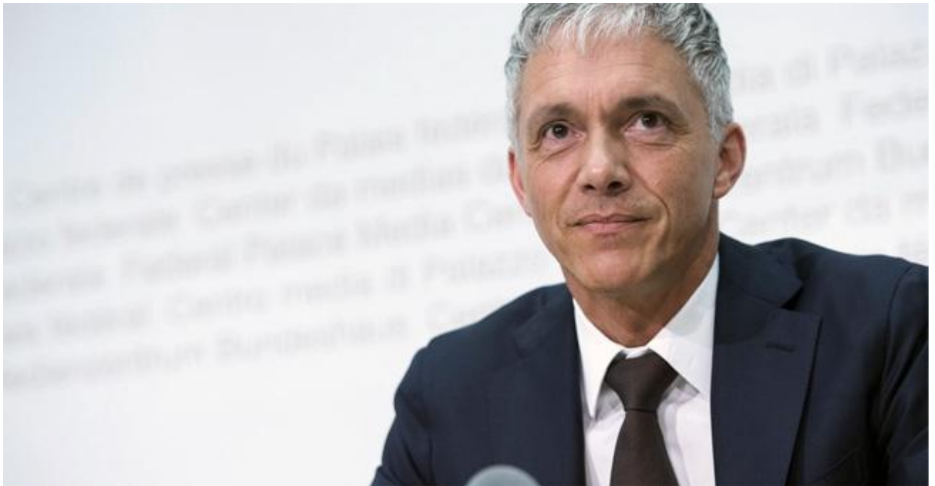
Procurador General suizo Michael Lauber

Verán, los $USD14 Trillones de dólares en un depósito en efectivo, en un banco offshore es lo que hoy es motivo de grave preocupación. Es real y está depositado, pero los federales (Reserva Federal), la CIA, Suiza y otros – le han dicho bien claro a esta persona que no se puede utilizar estos fondos.